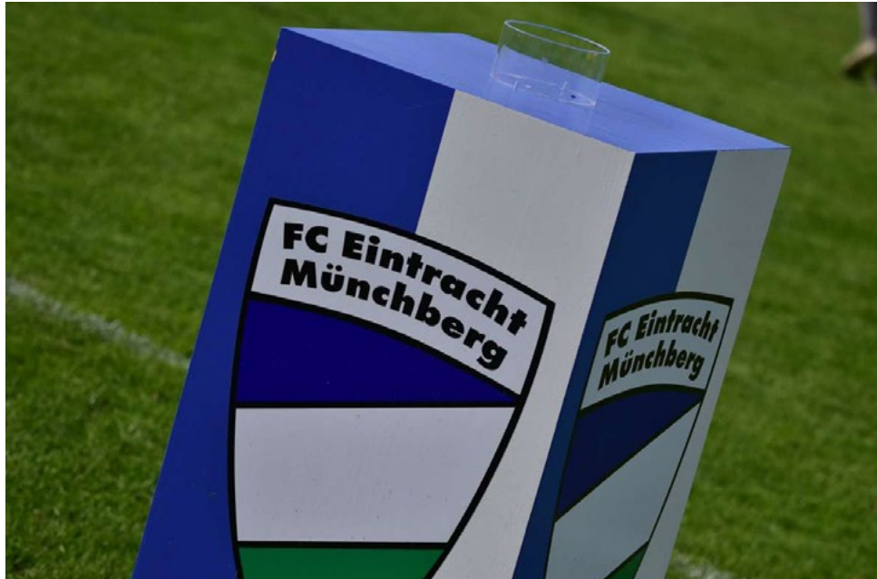
Erster Saisonsieg für den FCE.