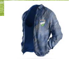
CO - TRAINER Bülent Sözen