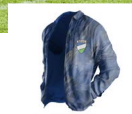
CO - TRAINER Bülent Sözen